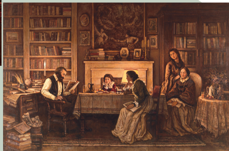
革命的一家人(油画) 孙景波作