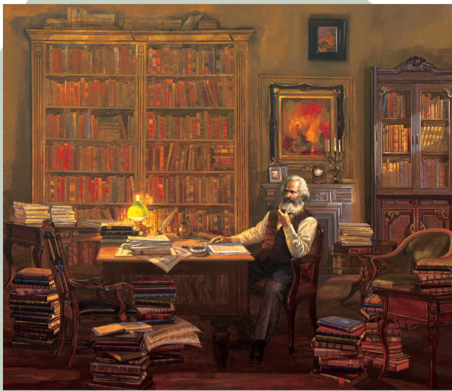
潜心写作《资本论》(油画) 孙立新作