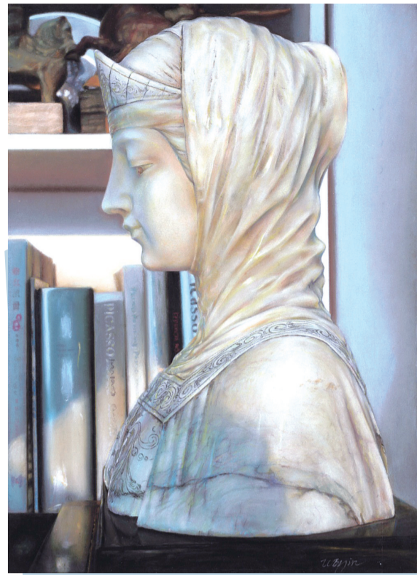
我心依旧(水彩粉画) 卫今