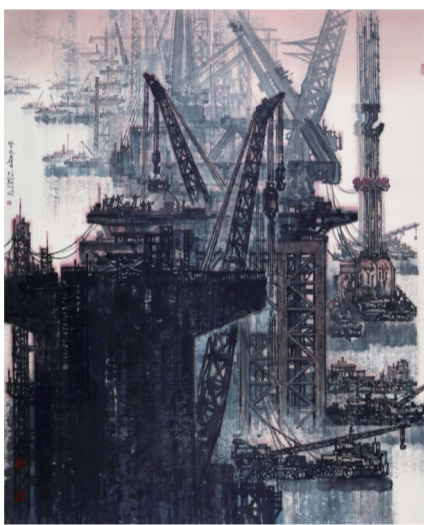
擎天巨臂——港珠澳大桥建设者之一 高鸣作

四届中国油画进京展,都试图以较大的规模梳理与呈现国画、油画的当下创作风貌。油画对于“中国精神”意涵的凸显,显然不只是指表面的“写意性”或“意象性”,而在于油画在具象写实、抽象表现、象征寓意等方面所表达的当下中国社会的精神心理,是当下社会的某种人文思潮通过油画呈现出的审美特征。中国油画的这种当代风貌,或许在以“中华意蕴”为主题的中国油画艺术国际巡展于7月18日在意大利首都罗马维多利亚诺宫展出所获得的异国回响,能够得到更加明确的印证。此展是继2016年7月中国油画国际巡展在法国巴黎布隆尼亚宫成功举办后,再度将中国当代油画的整体面貌呈现于油画故乡的展览。意大利艺术史学家、策展人克劳迪奥·斯特里纳蒂在该展研讨会发言时指出,中国油画不想成为西方的油画,但是中国油画接受了西方的技术。他认为,不是中国人来摸索西方的艺术技法,而是他们吸纳了我们对艺术的想法,吸纳了我们的文化和传统艺术史,同时没有抛弃中国的传统文化。意大利艺术史学家加布里埃莱·西蒙基尼在发言中表示,从这个展览的油画作品中可以看到一个比较关键的差别,中国的概念和西方的概念有很大的差别。中国的绘画传统在逐渐改变,中国艺术家和世界的关系也在逐渐改变,中国艺术家的艺术语言也在改变。应当说,意方学界对中国油画的评价是中肯而准确的,他们从中国油画里既看到了中国艺术的变化和与世界艺术的联系,也看到了中国从文化角度对这种外来艺术的再度创造。