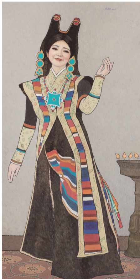
藏族宫廷舞 尚辉画 靳尚宣作