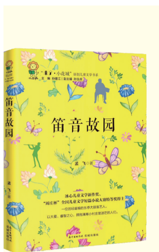
《笛音故园》 孟飞著 花城出版社 2018年7月出版

《笛音故园》以20世纪70年代末的冀东小村庄为背景,详实描绘了当地的风土人情、人民的生活状况。作品以儿童视角,讲述了一位乐亭大鼓盲艺人,在历经磨难的人生境遇中,始终保持着旷达、超脱的胸怀,以大爱、睿智之心,拥抱清寒小村庄里迷茫的人们的感人故事,表现出对于他人、自我、爱与恨、困境与希望等人生命题的深入思考。