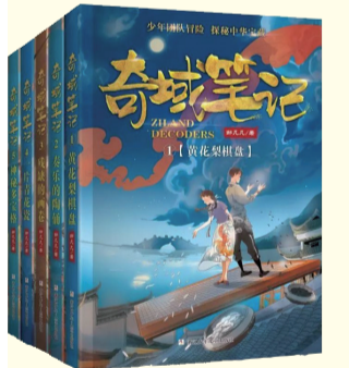
“奇域笔记”系列 邹凡凡著 浙江少年儿童出版社 2019年1月出版

土生土长的北京女孩晓莹就读于一个有着光荣传统的中学,每个班级都以“红班”的称号为最高荣誉。班长生病住院,一向低调的晓莹临危受命,协助老师管理班级。 这是一部写给青春前期孩子的现实题材儿童成长小说。作品回荡着一股青春生气与昂扬正气,既细致入微地写了少年们的心理、情感成长轨迹,更浓墨重彩地揭悉了他们追梦不止的精神。