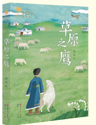
《草原之鹰》 鹿鸣著 人民文学出版社 2018年10月出版

“奇域”是间小小的网上古董旧货店,掌柜夏小婵,女,14岁。“奇域笔记”记录了她、冯川和小伙伴们的又一次寻宝之旅。通过围棋、乐舞俑、古画、青花瓷、多宝格这些传统文化符号,既写大历史,又写小人物;既写过去,又写当下,生动地展现了中华民族的悠久历史和灿烂文化。