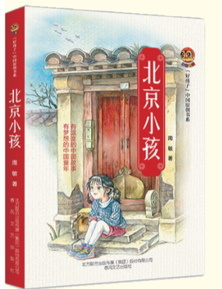
《北京小孩》 周敏著 春风文艺出版社 2018年10月出版

《笛音故园》以20世纪70年代末的冀东小村庄为背景,详实描绘了当地的风土人情、人民的生活状况。作品以儿童视角,讲述了一位乐亭大鼓盲艺人,在历经磨难的人生境遇中,始终保持着旷达、超脱的胸怀,以大爱、睿智之心,拥抱清寒小村庄里迷茫的人们的感人故事,表现出对于他人、自我、爱与恨、困境与希望等人生命题的深入思考。