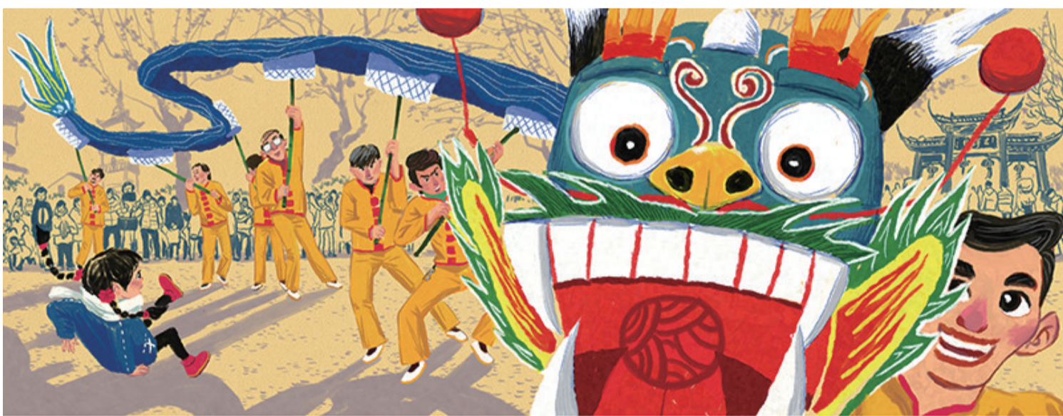
乐陵/文 洪啸/图:《龙牙齿不见了》,天天出版社2019年1月出版