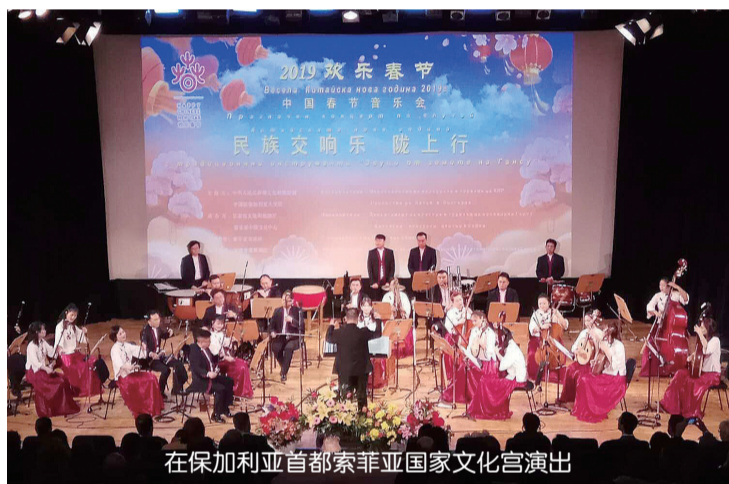
在保加利亚首都索菲亚国家文化宫演出

今年是中国和保加利亚建交70周年,《陇上行》演出在保加利亚产生了极大的轰动效应。尤其是在演出前观众入场时,循环播放《交响丝路·如意甘肃》宣传片,赢得现场观众的极大兴趣。