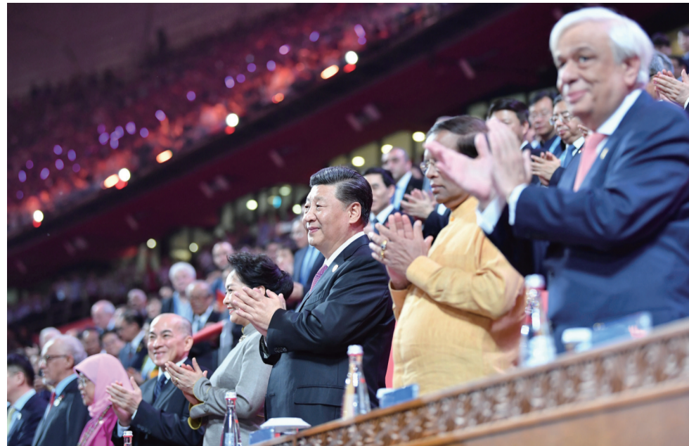
5月15日晚，国家主席习近平和夫人彭丽媛在北京国家体育场出席亚洲文明对话大会的外方领导人夫妇共同出席亚洲文化嘉年华活动。