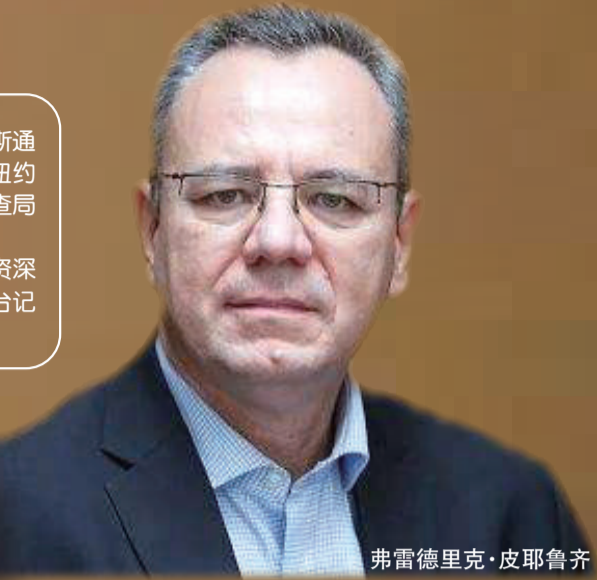
弗雷德里克·皮耶鲁齐

真实总是比虚构更精彩,生活总是比文学更热闹。作家的想象力似乎难以解释这个世界已经发生或正在发生的变化。不是想不到,而是这个世界变化太快。因此,非虚构作品所讲述的真实故事及其带来的意义,将越来越超过虚构作品对这个世界的变化所作出的理解或阐释,并成为一个时代的记忆,从而成为人类历史的一部分。《美国陷阱》就是这样一部具有标志性价值的非虚构作品。如果不是身处如火如荼、日益陷入“持久战”的中美贸易战的环境下,用耸人听闻、触目惊心这些成语来形容阅读《美国陷阱》后的感受,一点也不过分。但此时此刻的我们已经不是局外人。