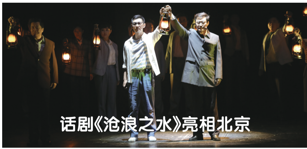
话剧《沧浪之水》亮相北京

创作从“高原”走上“高峰”，需要创作者拥有强烈的忧患意识与时代情怀。好的艺术作品既要能深入生活、传承民族的文化基因，也需以极强的当代意识和现代审美展现与世界、时代共通的思想与情感；同时，“独创性又是艺术高峰的生命线”，好的艺术作品需在形式、艺术形象及思想、境界与兴味蕴藉上体现出其独到创新之处。专家谈到，当下，文艺创作者向高峰攀登，让世界了解中国，是一个伟大的历史责任，也是一个长期的奋斗目标，这既需创作者的大胆突破，也需艺术研究者、文艺批评家、艺术管理者乃至艺术教育者和广大观众的合力保护与助推。只有整个社会从制度、体制、政策、机构到思想、文化、技术及人才等方面对文艺生产予以支持、支撑的合力，并从国家层面加以积极引导，文艺创作才能真正实现从高原迈向高峰的时代目标与使命。（路斐斐）