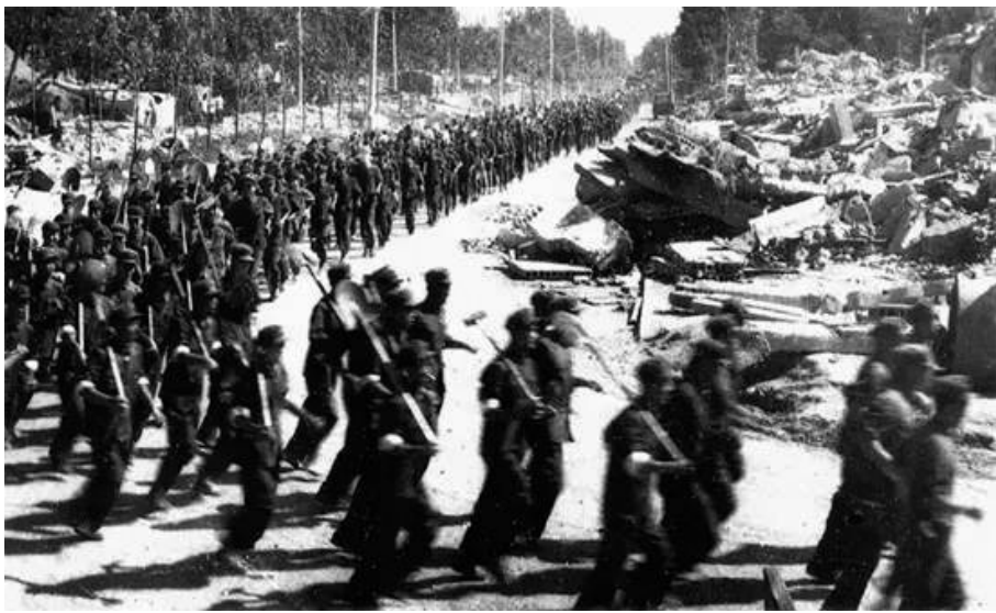
解放军各路救援大军昼夜兼程,以最快的速度赶到灾区,抢救遇险群众

没有大型救援设备和工具,没有专业救援技术和经验,战士们用手扒肩扛,救出一个个幸存的生命,挖出一具具罹难者的尸体,作者没有把自己写成高大全式的英雄,而是很真实地描述了自己第一次见到尸体的恐惧,因为在家时只见过爷爷奶奶去世后的尸体,正因为把遇难者都看作是自己的亲人,也就没有了恐惧心理。作者刚入伍就赶上部队执行急难险重的大项任务,因为在抗震抢险斗争中表现突出而火线入党,这在新兵中是难能可贵的,也是很值得骄傲和自豪的。作者以一个普通救援者的视角,来自第一现场的真实报道,用热血青年热烈而赤诚的情感,书写了