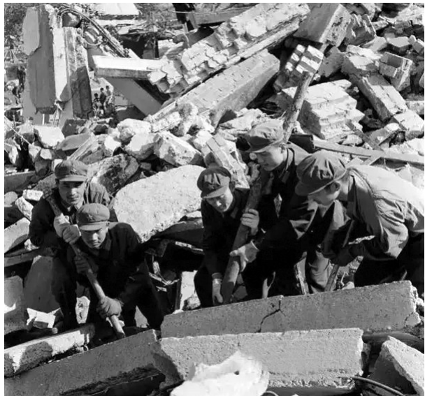
解放军在救灾现场

1976年7月28日,唐山发生的7.8级大地震,是中华民族历史上罕见的自然灾害,被列为20世纪世界地震史死亡人数第二,仅次于海原地震。地震发生后,许多作家用文字记录了那场毁灭性的灾难,其中,在地震发生10周年后,即1986年,钱钢的长篇报告文学《唐山大地震》影响最大,因为作者花去十来年的时间采访研究,立誓要为整个人类留下一场关于大毁灭的真实记录,留下关于天灾中人的真实记录。而在地震发生43年后的今天,我们又很欣慰地看到了马誉炜的自传体长篇报告文学《1976, 红星在唐山闪耀》,我用一天的时间把作品读完,很受感动,也很震撼。作者用自己参加唐山抗震救灾的亲身经历,所见所闻,所思所感,还原了当年灾难和救灾的真实场景,讴歌了人民子弟兵在抗震救灾中所表现出的大无畏的英雄主义精神,再现了在惨绝人寰的灾难面前,不屈不挠的中国人所表现的人性之光的大美和心灵之光的大爱。我认为,这既是作者一次刻骨铭心的心灵感悟和精神回顾,也是当年一名参加抗震救灾的战士,对唐山这座英雄的城市和英雄的人民倾情奉献的一份厚礼。