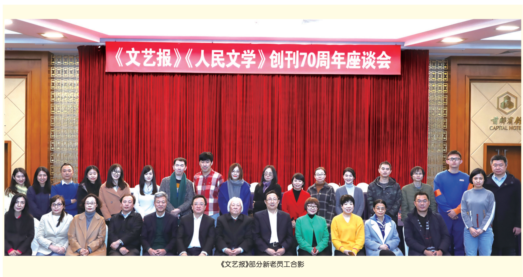
《文艺报》部分新老员工合影