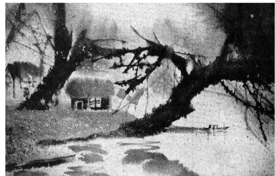
春日 冯骥才 作 发表于《文艺报》1996年5月24日