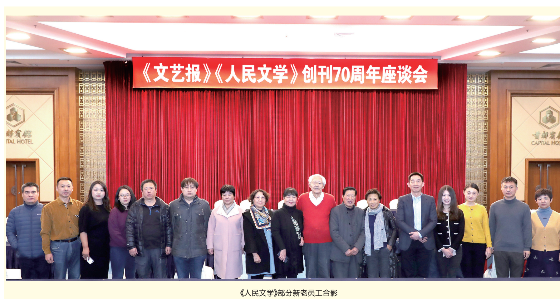
《人民文学》部分新老员工合影