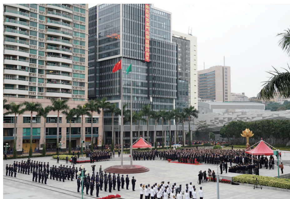
十二月二十日，澳门特别行政区政府隆重举行升旗仪式，庆祝澳门回归祖国二十周年。