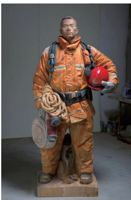
烈焰青春 焦兴涛作