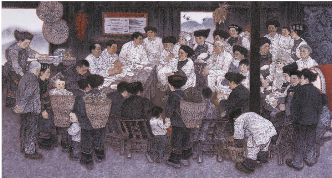
暖心——十八洞村贫困户精准识别公示会 王奋英作

许多重要的历史节点在被现实唤醒的同时,也会赋予现实以深邃的意涵。2019年先后迎来五四运动100周年、新中国成立70周年等重大历史节点,这使得本年度有关美术的创作、展览与研讨都似乎被嵌定在一种回望历史的语境之中,从而为这些作品与活动预设了题材标识与话语范围,甚至这些作品与活动也成为历史的一种组成。本年度推出的最重要的创作与展览,无疑是各地美术机构积极策划组织的庆祝新中国成立70周年的各种美术创作展览活动,并最终汇集为规模宏大的第十三届全国美术作品展览。而有关对展览之中美术作品现代性特征的审视与探讨,又无不体现了从五四新文化运动以来展开的中国美术现代性变革命题。