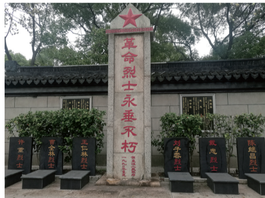
用直镇政府烈士陵园中的陈继昌衣冠冢(右一)