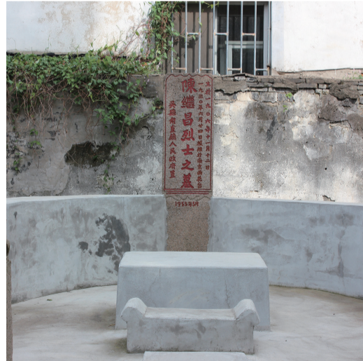
安葬在家中院子里的陈继昌烈士墓

1919年五四运动期间,叶圣陶带领学生们走上街头,使千年古镇第一次发出反帝反封建的声音。