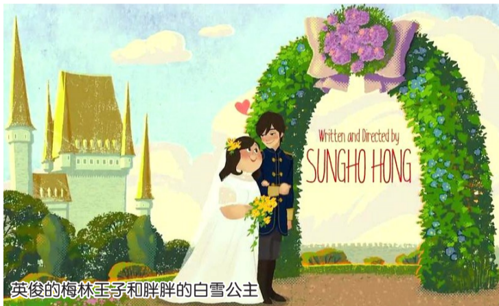
英俊的梅林王子和胖胖的白雪公主

在影片的结尾，脱下红鞋的白雪公主与英俊的梅林王子终成眷属，这个美好的结局给现实生活涂上了一抹希望的颜色。真爱究竟是什么？无论是否美丽，青春都无法永驻。容颜终会老去，只有伴随着皱纹的圣洁灵魂，值得被珍爱一生。