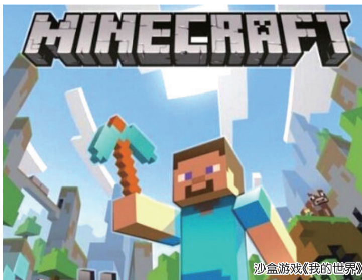
沙盒游戏《我的世界》

这并不是一部有着复杂深刻主题的电影，它故事清晰完整，节奏简单明快，画面色彩艳丽，场景绚丽绚美，细节丰富生动，人物个性鲜明，它更多地是为青少年提供一道精致的有趣的视听游戏，让人们的心绪随着主人公的冒险而跌宕起伏，在影片结束后也能收获一些快乐和感动。囿于电影篇幅和叙事角度，它无疑存在些许缺陷，但依旧不失为一部合格线之上的合家欢电影。