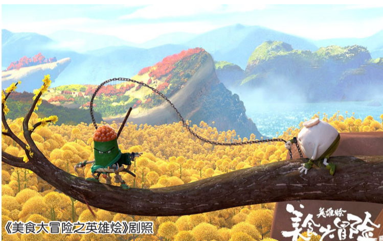
《美食大冒险之英雄烩》剧照

主人公包子名字叫包强，一心一意想做拯救世界的英雄，在被面仙国讨伐海盗的舰队拒绝后，他搭上老油条油万金的伙食船，随舰队一同出发。在船上，他与烧饼、花卷、饺子斗斗成为好友。舰队遭到海盗袭击，包强阴差阳错地与敌人三文鱼子寿司武藏锁到一起，二人漂流海上，流落岛屿，斗猴子、战豆蛙，在共同经历了一系列紧张刺激的冒险后，他们成了相互信任的好友。与此同时，海盗头目章鱼探知面仙国舰队打着讨伐海盗的名义，实际目的是要去找五味石，便要挟拿伊巧巧和馒头四海带他去找，他要通过五味石实现“让世界只有咸味”的邪恶计划。经过一番艰难的战斗，包子和武藏携手击败了章鱼，拯救了世界。伊巧巧也将五味石留在原地。