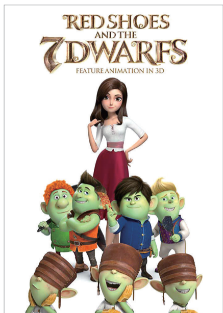
《红鞋子和七个小矮人》海报