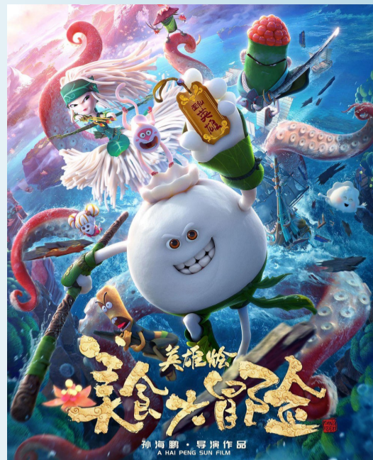
《美食大冒险之英雄烩》海报