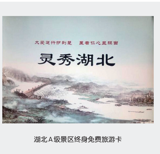
湖北A级景区终身免费旅游卡