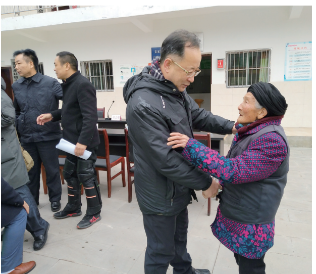
四川省作协赴渠县大田村慰问结对帮扶户

本报讯 3月25日，伴随着抗击新冠肺炎疫情的阶段性胜利和全国各行各业有序复工的铿锵脚步，四川省作协与人民网四川频道共同主办的“四川报告：脱贫攻坚大决战”报告文学(非虚构)专栏上线。截至目前，已有近百篇、长达60多万字的报告文学作品陆续刊发，全面展现了四川脱贫攻坚的壮举与硕果。这项活动只是四川省作协以文学的力量助推脱贫攻坚的一个缩影。3年多来，四川省作协深入学习贯彻习近平新时代中国特色社会主义思想，坚持以习近平新时代中国特色社会主义思想为指导，坚持以人民为中心的创作导向，周密策划，精心组织，扎实开展“深入生活、扎根人民”主题实践活动，特别是围绕四川省委、省政府“坚决打赢脱贫攻坚战”的决策部署，全面开展为期4年的文学扶贫“万千百十”活动，成效显著。