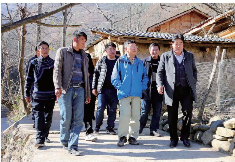
四川作家赴昭觉县悬崖村进行脱贫攻坚主题采访

成果进行认真研究，把握活动整体动态，全力支持指导。四川省作协党组书记、常务副主席侯志明说：“通过这一系列活动，作家们抢抓新机遇、迎接新挑战，秉承现实题材创作的优良传统，把目光投向了脱贫攻坚，投向了这场伟大的社会实践。”