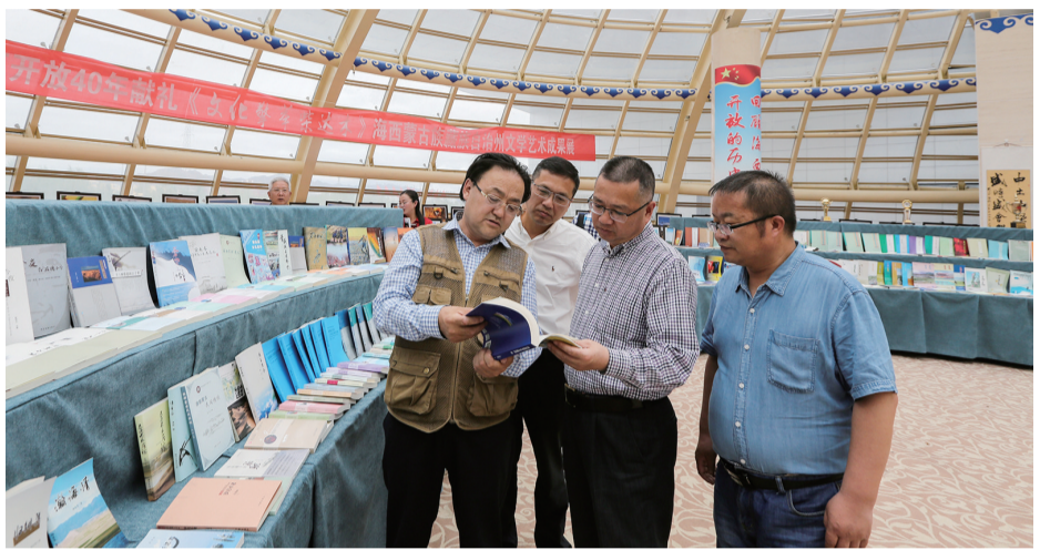
浙江青海两省作家参观文学艺术成果展