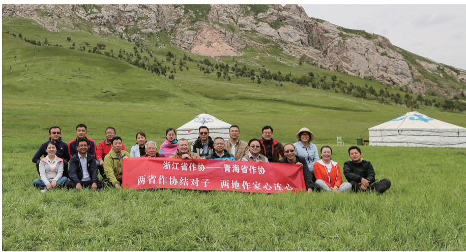
浙江青海两省作家交流结对

2009年,浙江、青海两省作协积极响应中国作协倡导并组织实施的东西部作协“结对子”合作交流机制。浙江对口青海文学扶贫工作展开11年来,两省深入广泛地开展了文学交流、作家培训、作品研讨、作家采风等多方面的合作,为作家之间搭建交流学习桥梁,有力地推动了两省文学发展繁荣,青海文学也日益呈现出高原文学特有的活力和风采。