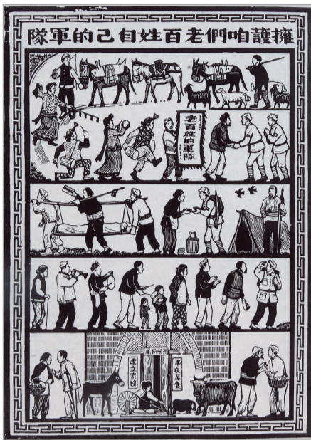
拥护咱们老百姓自己的军队 (木刻 1943年) 古元作