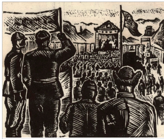
延安各界纪念抗日阵亡将士大会 (木刻 1938年) 江丰作