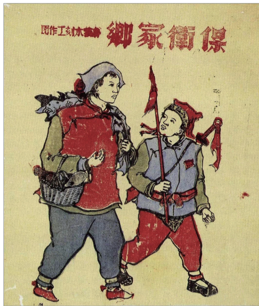
保卫家乡(套色木刻 1940年) 彦涵作