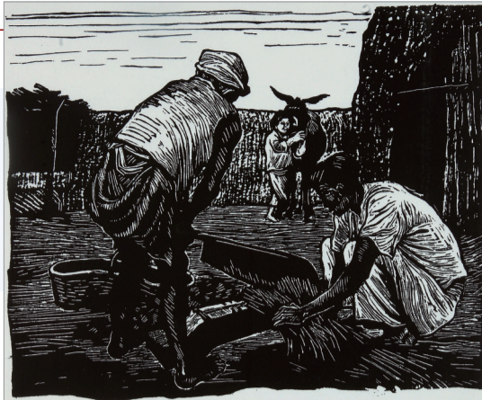
割草(木刻 1940年) 古元作