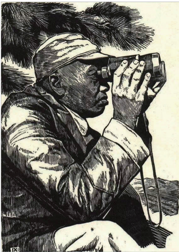
彭德怀将军在抗日最前线(木刻 1941年) 彦涵作