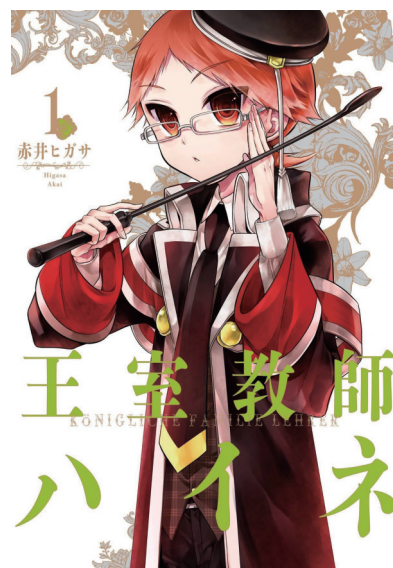
漫画《王室教师海涅》书封

作为一部探索人物心灵成长的动画电影,《姜子牙》的艺术性远高于娱乐性,写实性远高于幻想性,它很难让观众轻易产生代入和共情,也很难进行一言以蔽之的概括与总结。因而,《姜子牙》必然是具有争议性的。可正如影片宣传语所说:“用你自己的方式,去成为一个真正的神”。中国动画人可以用自己的方式去讲述扎根于中国传统文化的故事,解构神话或历史上搅动风云的人物,让那些神话、传说、历史、传奇拥有现代性乃至后现代性的解读空间和展示渠道——中国动画人可以竭尽全力拓展中国动画的广阔边界,磨砺属于中国动画的封神之作。