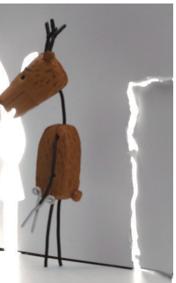
《兔子和鹿》中二维的兔子和三维的鹿