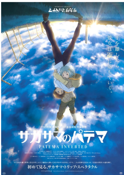
《颠倒的帕特玛》海报