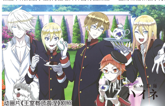
动画片《王室教师海涅》剧照

针对王子们各自擅长的领域,海涅老师制定了不同的教学计划,真正实现了因材施教;同时他也真诚地与他们沟通,打破了王子们对老师的刻板印象,让他们开始接受这位与众不同的家庭教师。让王子们接受适合自己的课程和教学方式只是第一步,作为国王