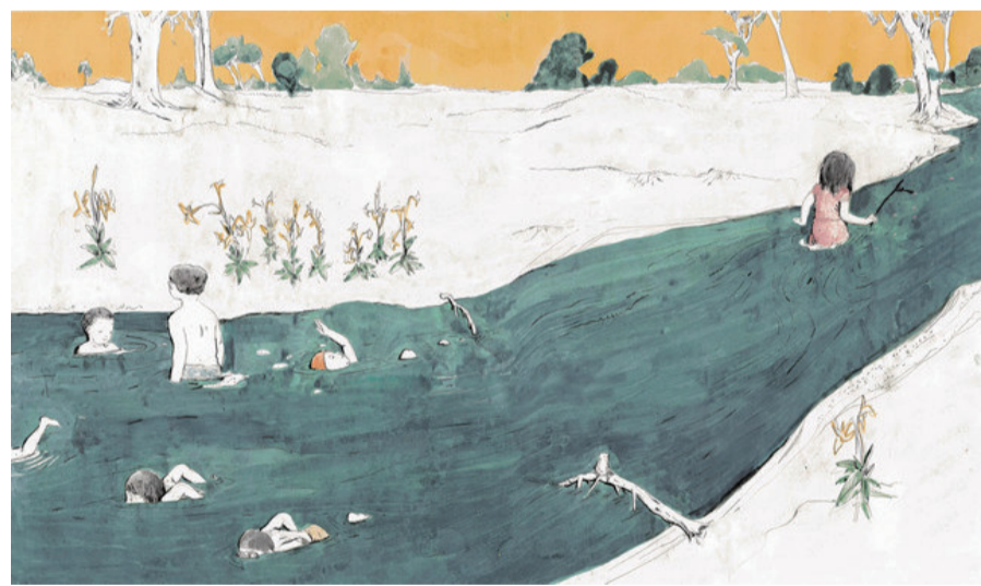
绘本《游侠小木客》内页

读一首古诗词的时候，我们可能首先注意到它讲的是什么样的自然场景，以及我们有没有经历过这样的场景。通常我会请小朋友先就对诗歌的最初印象互相交流，这实质上是一个回忆并重新唤醒的过程，一些平时被我们所忽略的情景可能在此时被回忆起来。