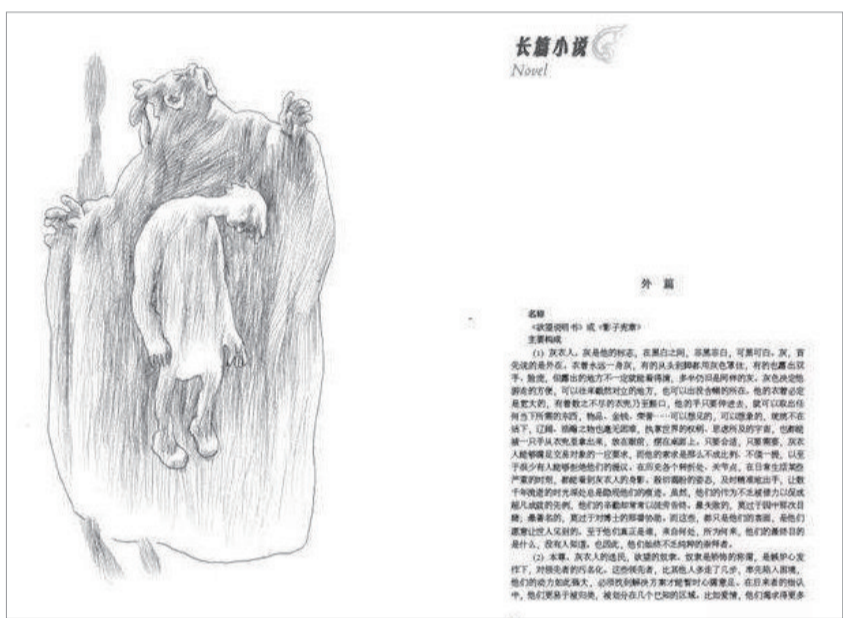
《灰衣简史》“裁花城”2020年第1期

是能见到虚荣的盛大,却享受不到虚荣的满足,她感受到一切,都只是对比之下的伤害与羞辱”……冯将女演员安排在独栋别墅,“望镜所及,每一个房间,每一寸地方,都恰如其分地明亮”,“所有窗帘一律拉开,百叶窗也都打开,在冯“紧紧逼视的双眼”中,女演员生活的全貌甚至拇指上的印迹都清晰可辨。这种视觉单向性的窥视无疑意味着权力的管控。然而,当两人交谈时,一个刹那,“她忽然直视着她的双眼……这时,你明白之前在车里通过望远镜对她的判断是错的,她的目光平静,却并非空无一物,那里面是柔和的、没有具体呈现的、却又无所不在、生生不息的生命力”。女演员“反视”的这一幕,是主动的、自由的、完全逆转了不平等关系的一眼,平静之下有决绝的抗争,此前冯先生通过望远镜“紧紧逼视的双眼”,断然无