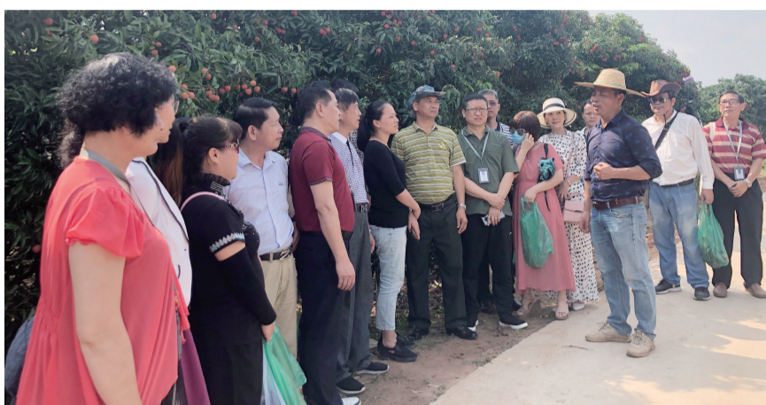
作家走进遂溪县乌塘镇梧川村,举行“梧川-荔枝”文学助力乡村振兴采访活动