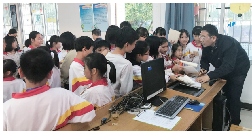
广东省作协以“文学精准扶贫”为主题开展“文学进校园”活动

本报讯 2018年10月23日,第六个国家扶贫日过去仅6天,习近平总书记来到广东清远市英德市连江口镇连樟村,深情地对村民们说:“乡亲们一天不脱贫,我就一天放不下心来。”如今,连樟村的广场上立着一块大石,上面就镌刻着习近平总书记这句千钧嘱托。近年来,广东作协积极响应打赢脱贫攻坚战的号召,动员组织会员作家沿着习近平总书记在广东扶贫的足迹,先后分期分批前往清远、连州等贫困地区进村入户访贫问苦,加大文学服务社会的力度和深度,争取在脱贫攻坚战中发挥文学工作的独特作用。