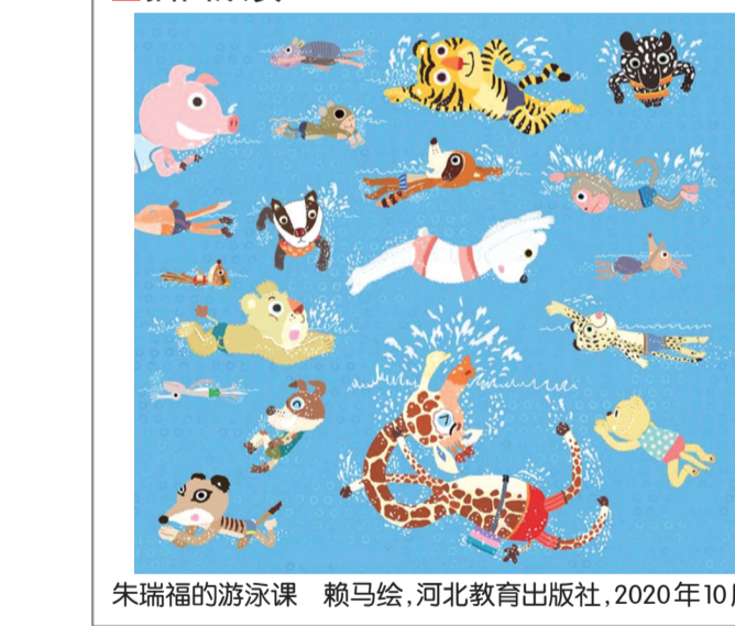
朱瑞福的游泳课 赖马绘,河北教育出版社,2020年10月