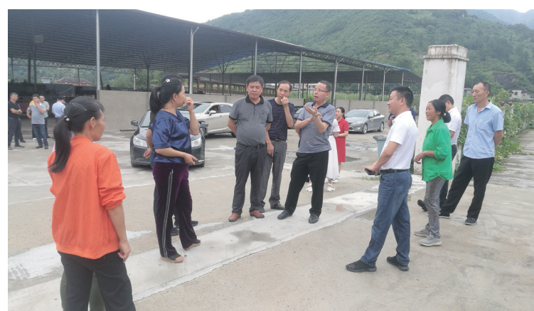
作家听老乡们介绍脱贫攻坚情况