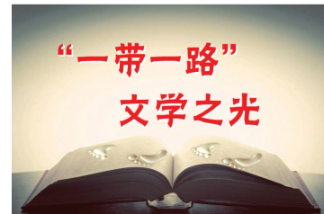
“一带一路”文学之光

多年以前,克鲁迪的父亲想让儿子如他一样成为律师,可是得到的反馈是,“我要去布达佩斯成为诗人”。在布达佩斯,克鲁迪并没有写过一首诗,他也没能成为诗人,但在他的小说中却有着诗一般的语言。虽然诗,伟大的作家都是语言大师似乎是一个常识,但是像克鲁迪那样将复杂的匈牙利语转化成错落有致的复句或干脆写成短句者并不多见,“像棺木滑向墓穴”,“像一本合上的日记”,“像乡下来的牛奶”,类似这样的比喻在《太阳花》中此起彼伏、随处可见,就像山多尔说的那样,“他只需寥寥几笔就能勾勒出有关性、肉体、人之残酷和绝望的末日景象”。从这个意义上说,《太阳花》既是传奇,又是诗。