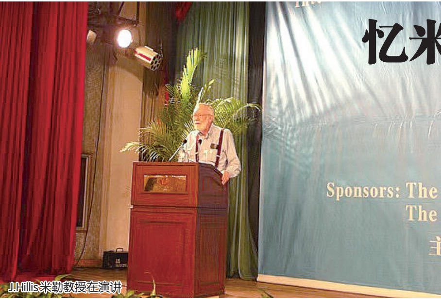
J. Hillis Miller 米勒教授在演讲

2021年2月9日,在微信朋友圈看到有朋友发的米勒(J. Hillis Miller)教授去世的消息,真是难以相信,在朋友的微信后面跟帖询问真假。虽然我也知道,一旦这样的消息出来,大概不会有错。自己只是不愿意相信而已。到推特上去看,也有不少美国学者在转发此消息。但我还是想看到更加正式的消息,我登陆米勒先生所在的美国加州大学厄湾分校的官网,还没有。当时还抱着侥幸的心理。但第二天,2月10日,加州大学厄湾分校的讣告就发布了。米勒先生确已归去了。