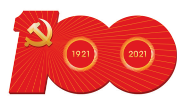
庆祝中国共产党成立100周年 The 100th Anniversary of the Founding of The Communist Party of China