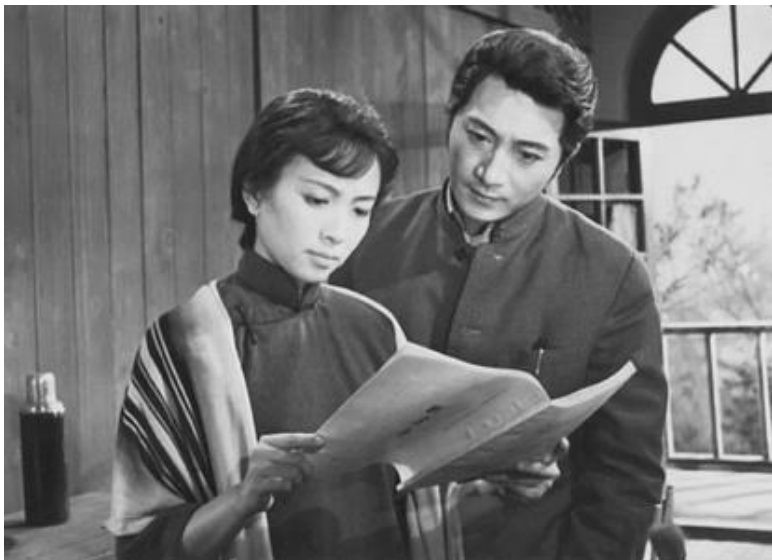
1963年, 谢铁骊根据《二月》改编的电影《早春二月》剧照

电影导演谢铁骊尤为偏爱五四时期的小说, 他认为《二月》不是“才子佳人”的忧郁生活, 而是讨论知识人面对革命, 是顺流而进, 还是急流勇退, 这恰恰反映着革命的人道主义。但谢氏改编《二月》时, 对柔石略显消极的结尾——萧涧秋去了女佛山——做了修改, 即让萧涧秋奔向革命。谢铁骊剧本《二月》于1962年2月16日完成, 载1962年6月7日《电影创作》第三期。后来夏衍很重视这部剧, 他认为原著小说中的“二