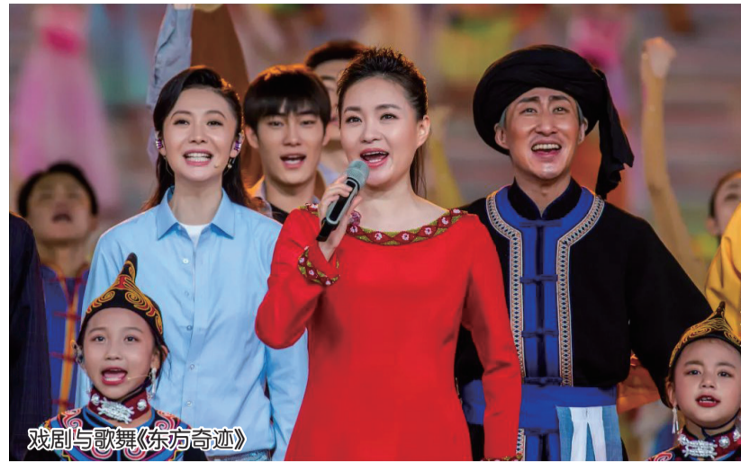
戏剧与歌舞《东方奇迹》