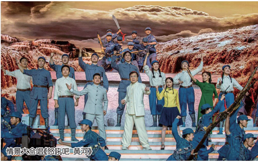
情景大合唱《怒吼吧 黄河》