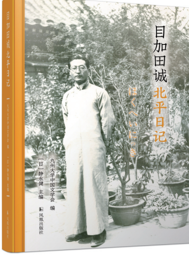
目加田诚北平日记

《目加田诚北平日记》是日本汉学家目加田诚在1933年10月至1935年3月留学北平期间的日记，经过九州大学中国文学研究室整理并详细注释，由静永健教授主编出版。二战前夜的世界犹如暴风雨前短暂的宁静，其间有不少学者前往中国留学、游历。20世纪30年代，西方学者如拉铁摩尔参观了陕甘宁边区，本尼迪克特·安德森正在云南度过童年，而就在目加田诚踏上留学之旅的同一时间，英国史学家费正智出版了第一部英文唐太宗传记《天之子李世民》，希望英语世界的读者能将目光投向古老而文明的中国。日本著者的游记、日记有很多，如内藤湖南《燕山楚水》、吉川幸次郎《我的留学记》、青木正儿《江南春》等早已译成中文出版。但是目加田诚的日记颇为特殊，他从来没有向人说起过这些日记的存在，直到2012年大野城市府整理目加田诚书籍文稿，这8本笔记本才从一个糕点包装盒中重见天日。因此，与内藤等人的游记不同，目加田诚北平日记并不是为了发表而创作，而是完全私人性质的书写。