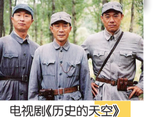
电视剧《历史的天空》