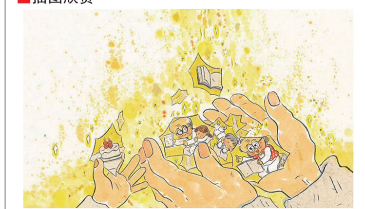
《爷爷调工作了》插图，李卓颖 绘，二十一世纪出版社 2022年5月