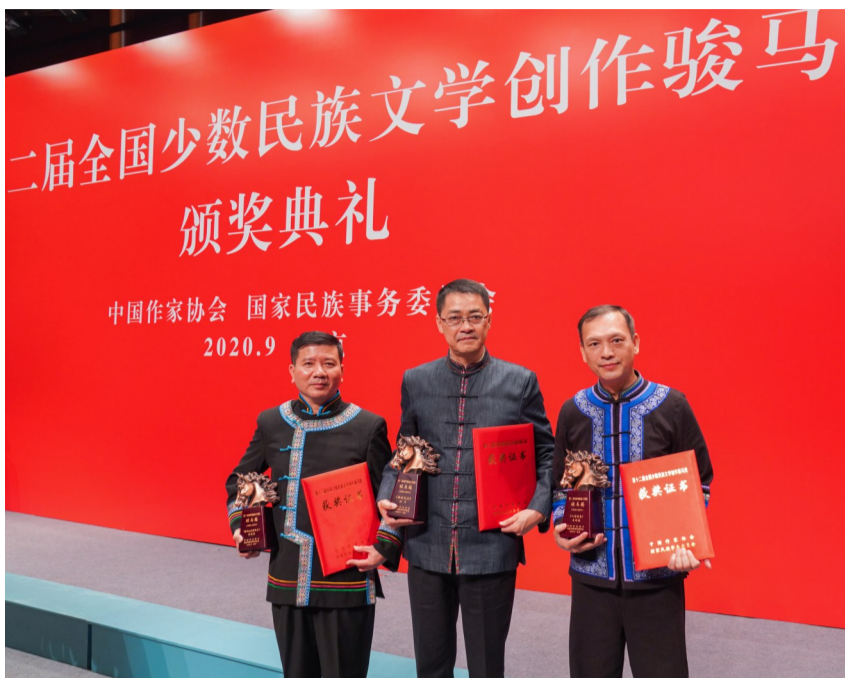
广西三位作家获第十二届全国少数民族文学创作骏马奖