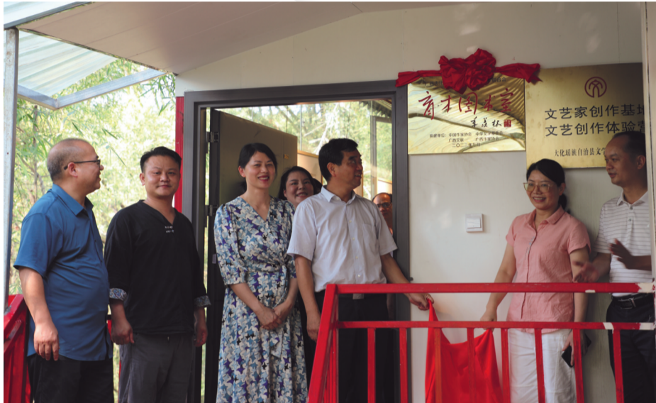
“育才图书室”揭牌(广西大化)

广西作协通过实施《广西优秀原创文学作品扶持办法(暂行)》、文学桂军“出名家 出名作”项目等举措,组织广大作家向国内文学名刊大刊发起冲锋。《办法》自2019年实施以来,广西作家在