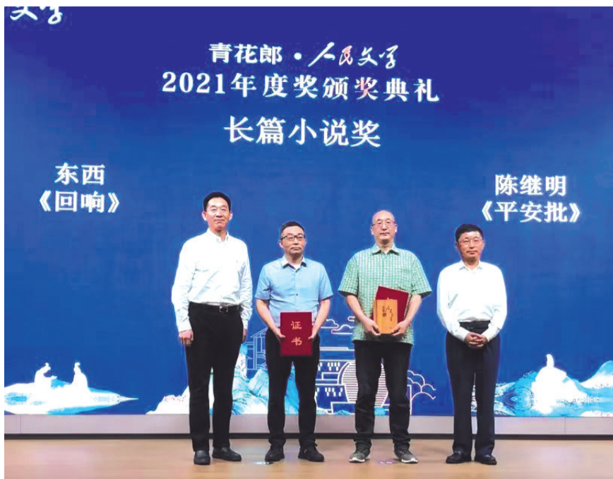
东西长篇小说《回响》获2021年度人民文学奖“长篇小说奖”