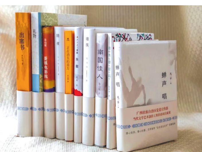
文学桂军“出名家 出名作”成果

民心相通,文学为桥。背靠强大的祖国,中国文学日益受到国外读者关注,在全球语境中的对话沟通能力显著增强,正向世界自信地展示真实、立体、全面的中国,为构建人类命运共同体贡献着文学力量。广西作家在走向世界方面没有落伍,他们面向东盟、面向世界,着眼“一带一路”,