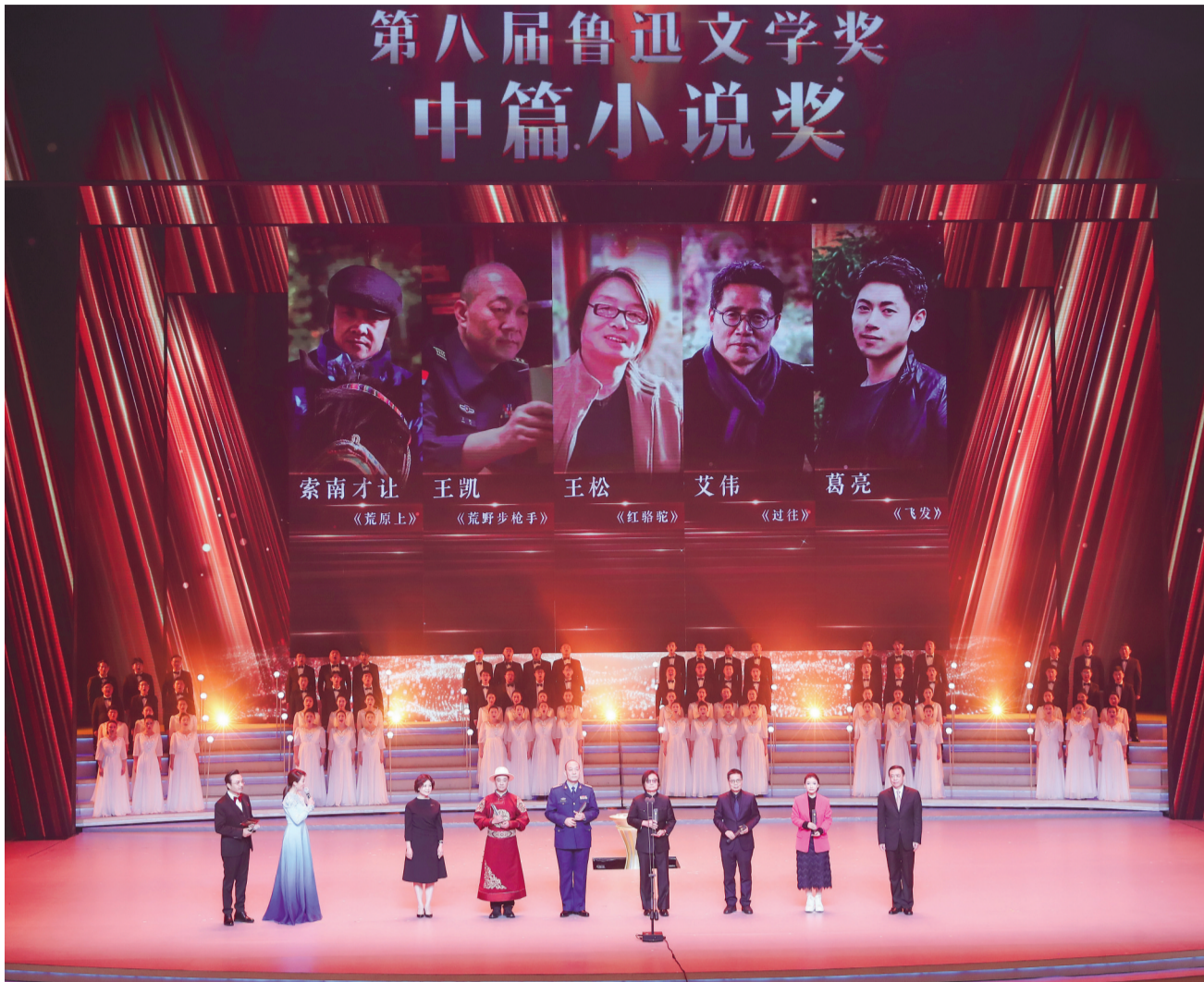
铁凝和张宏森为第八届鲁迅文学奖中篇小说奖获奖者颁奖