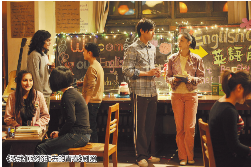
《致我们终将逝去的青春》剧照

伴随着互联网技术的突飞猛进，大量碎片化信息充斥大大小小的屏幕，如何让用户获取有文化价值的信息，如何让年轻一代在瞬息即逝的信息海洋中确认自己的文化身份，已成为互联网文化产业面临的重要课题。近年来，网络文学蓬勃发展势头迅猛，尤其是在海外传播上取得了可喜的成绩，并通过IP这一文化产业模式讲述中国故事，让业界找到了一条借助网络传播中华优秀传统文化的道路。无论是产业规模还是社会效应，优质IP所发挥的能量都是以前单向运作无法企及的，网络小说与影视剧、游戏和动漫的互动形成了互联网时代全新的文化景观。