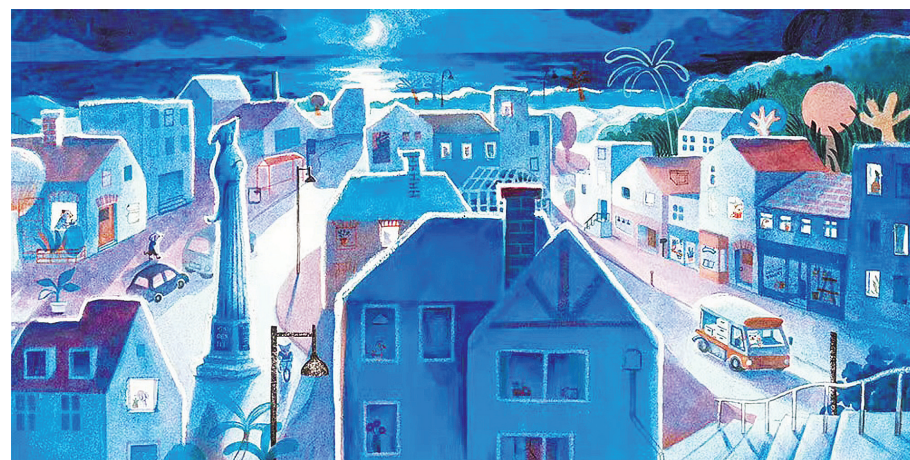
《我们待会儿见》插图,黄雅玲绘,山东人民出版社,2019年8月