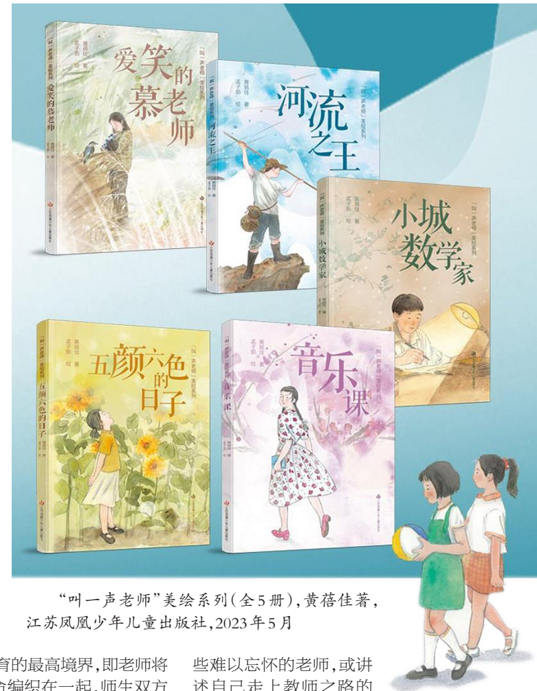
“叫一声老师”美绘系列(全5册),黄蓓佳著,江苏凤凰少年儿童出版社,2023年5月

不仅如此,美绘系列还邀请到周益民、张祖庆、冷玉斌、李祖文、王文丽五位一线名师讲述自己的故事。他们或描摹自己在学生时代遇到的那