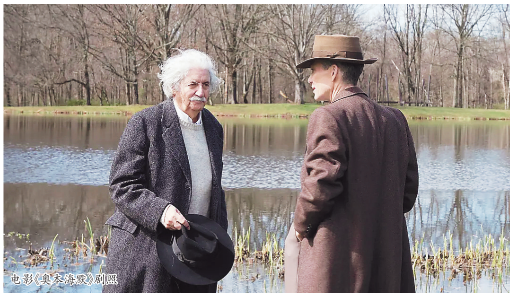
电影《奥本海默》剧照

奥本海默当然是有过左翼思想。确实,他的不少同道和朋友都在20世纪30年代那个全球红色的年代里参与了美共。这其实是20世纪30年代许多西方知识分子的选择。大萧条所带来的冲击让西方社会的弊端暴露得淋漓尽致,而当时苏联的崛起则充满吸引力。这让许多西方知识分子对西方社会失望,在当时选择和左翼站在一起。电影真切地描绘了奥本海默和左翼的联系,给西班牙内战的反佛朗哥力量捐款、参与左翼的集会、遇到他的左翼的情人和妻子、参与某些工会