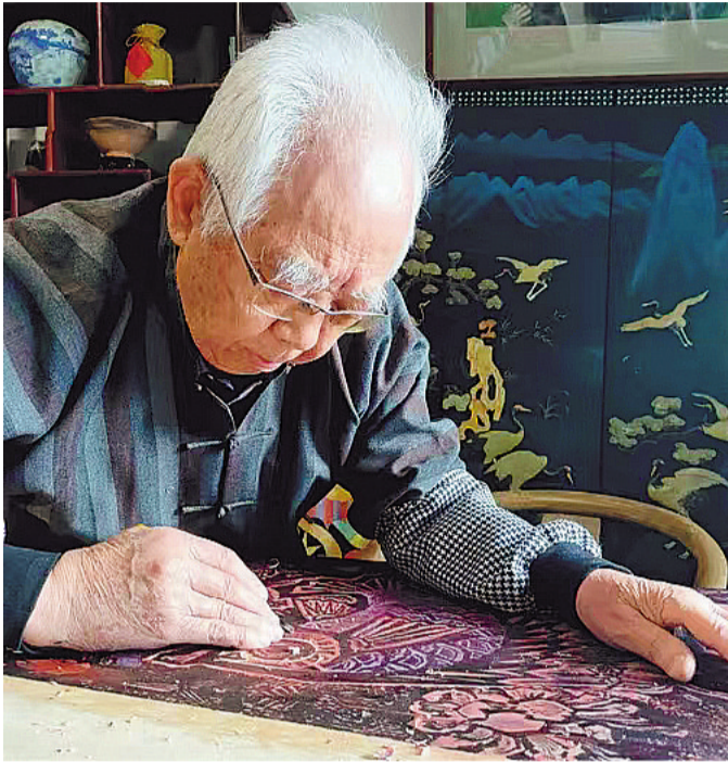
晚年张家瑞在创作版画

天地间又一位耕耘者去了,留下一笔丰厚文化遗产的同时,也留下了一片寂寞的空白。得知版画家张家瑞先生不幸离世,我心情沉重地抚摸着他的八卷本文集,浮想联翩。张家瑞先生九十高龄悄然离世,堪称吉人高寿。有那么多年轻朋友自发怀念他,可见他的人品与艺品之高、影响深远。张家瑞先生是个热心肠,又是一位痴迷于版画创作的老报人、大画家。他长期专注于版画和藏书票创作,在艺术鉴赏和评论领域坚持耕耘,最终形成了独树一帜的艺术风格,成为中国画坛翘楚人物。先生自幼酷爱绘画,同黄永玉先生一样,并非科班出身,但却天赋超群、刻苦过人,可谓“通才”。在艺术探索的道路上,不求名利,埋头创新,实属难能可贵。直到晚年满头飞雪之时,仍然手持刻刀伏案工作,为青年艺术家的成长浇水培土,在文化界树立了高标楷模。