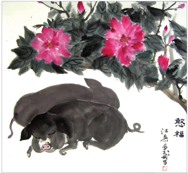
牡丹花下睡,憨福自然来。相偎小无猜,梦里少尘埃。 江岳 图/文