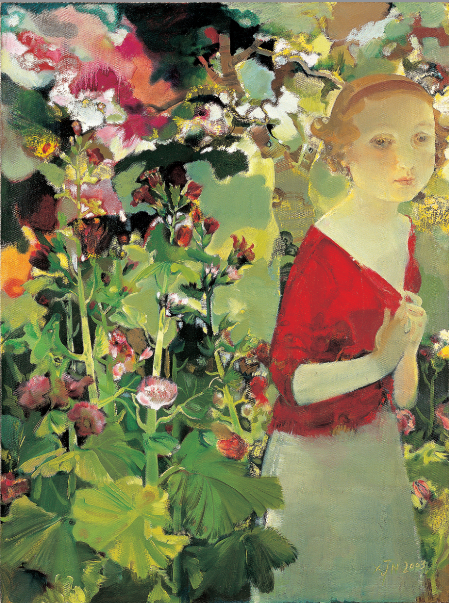
红衣少女(布面油彩 80×60cm 2010)