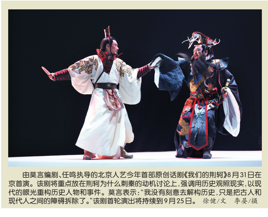
由莫言编剧、任鸣执导的北京人艺今年首部原创话剧《我们的荆轲》8月31日在京首演。该剧将重点放在荆轲为什么刺秦的动机讨论上,强调用历史观照现实,以现代的眼光重构历史人物和事件。莫言表示:“我没有刻意去解构历史,只是把古人 and 现代人之间的障碍拆除了。”该剧首轮演出将持续到9月25日。 徐健/文