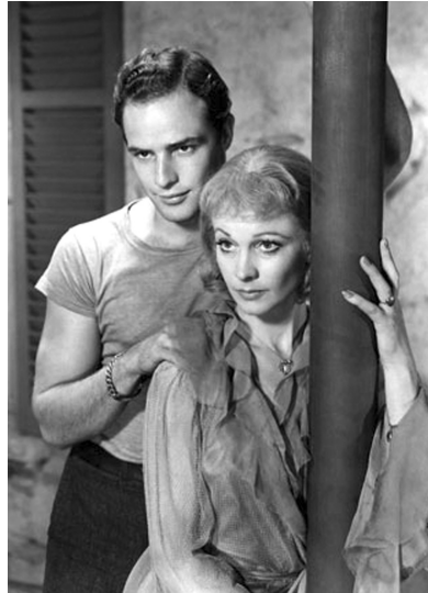
《欲望号街车》电影剧照