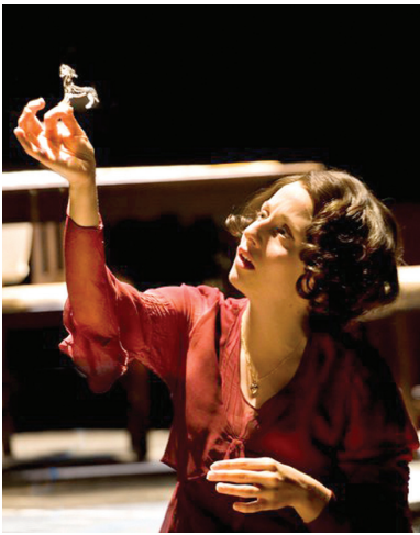
《玻璃动物园》话剧剧照