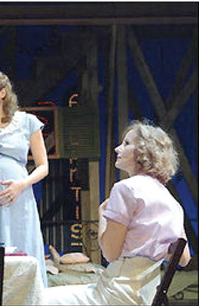
《欲望号街车》话剧剧照

于放纵欲望，终于丢了工作，成了被镇长驱逐的“不受欢迎的人”。是欲望将她这只脆弱的“飞蛾”送到了毁灭的灯火中——妹夫斯坦利的家。作者将后者喻为一只羽毛鲜艳、身体强壮的“雄鸟”，他象征着粗鄙的新兴工业文明，是坚实的、侵略性的现实存在，终于撕碎了总是一身白衣、仿佛一个稀薄影子的“飞蛾”。