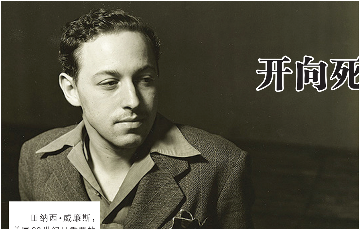
田纳西·威廉斯，美国20世纪最重要的剧作家之一。他于1948年及1955年分别以《欲望号街车》及《热铁皮屋顶上的猫》赢得普利策戏剧奖。

60年前一个秋日的黑白银幕上，在新奥尔良火车站的烟尘中，一代英伦名伶费雯丽语气飘忽地念出了女主人公布兰奇的第一句台词，也是《欲望号街车》的题眼：“他们让我坐欲望号街车，然后换乘公墓号，过六个街口下车便是天堂区。”