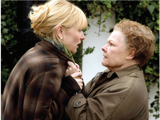
《丑闻笔记》电影剧照