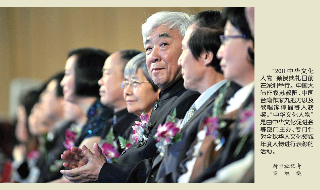
“2011中华文化人物”颁授典礼日前在深圳举行。中国大陸作家苏叔阳、中国台湾作家九把刀以及歌唱家谭晶等人获奖。“中华文化人物”是由中华文化促进会等部门主办、专门针对全球华人文化领域年度人物进行表彰的活动。

据悉,四川的《星星》诗刊和重庆的《红岩》杂志将以此为契机,联手展示“巴蜀诗坛”的阵容与实力,川渝两地作协还将每两年编辑出版一本《巴蜀诗坛》。