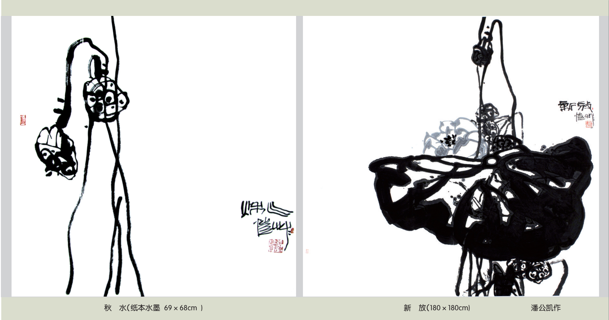
秋 水(纸本水墨 69×68cm)