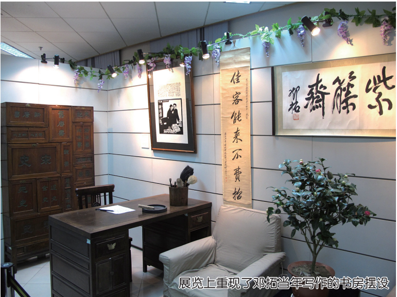
展览上重现了邓拓当年写作的书房摆设

铁凝说,今天这个时刻使我想到了很多。一是,邓拓同志的诗文之所以具有长远的生命力,至今被人喜爱,是因为它们亲切温馨、渊博隽永、短小精悍,更因为它们饱含着智慧,饱含对人生和世事的深切体悟,所以经得住岁月的消磨,经得住时代变化的考验。邓拓同志的创作表明,惟有精品力作,才是作家的艺术生命所在。二是,邓拓同志是作家,但他首先是战士,或者说他生命的三分之二属于行