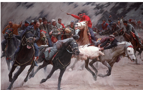
叼羊 白钢 作

本报讯(记者 徐健) 由文化部、新疆维吾尔自治区人民政府共同主办的“新疆好·新疆美术作品展”3月4日至12日在中国美术馆举办。本次展览是新疆繁荣发展的缩影和印证,也是新疆美术创作新成果的一次集中展示。本次展览在短短3个月时间内,共征集到了新疆401位画家的2120幅作品,画家涵盖了新疆各个州、有汉族、维吾尔族、哈萨克族、回族、柯尔克孜族、蒙古族、塔吉克族、满族、俄罗斯族等。最终,有135位作者的135幅作品入选参展。这些作品主题鲜明、题材丰富、形式多样、特色浓郁。新疆的山水、草原、戈壁、大漠以及勤劳勇敢的各族人民、绚丽多姿的民族文化、丰富多彩的现代生活和极具时代特征的民族精神风貌都在作品中得以淋漓展示,展览充分显示了新疆本土美术的发展和新疆题材美术创作的繁荣。