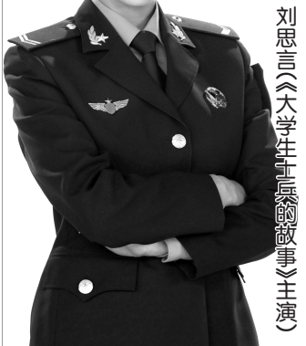
刘思言《大学生士兵的故事》主演