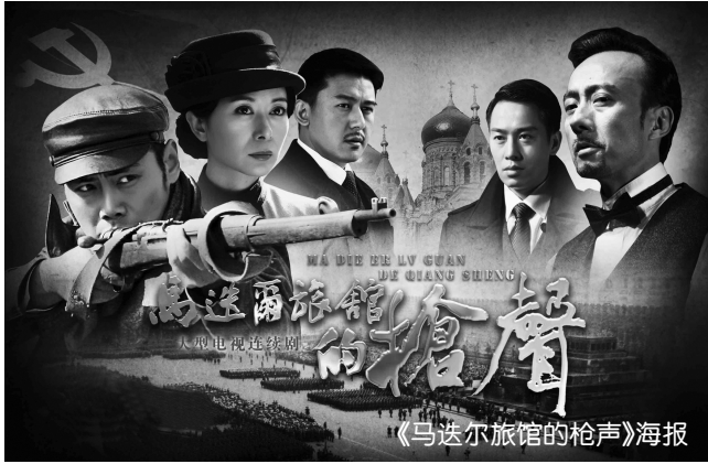
《马迭尔旅馆的枪声》海报

二是电视剧类型化追求更趋开放自觉。类型元素更加新颖,综合观赏价值追求得到空前重视。《我是特种兵》在同