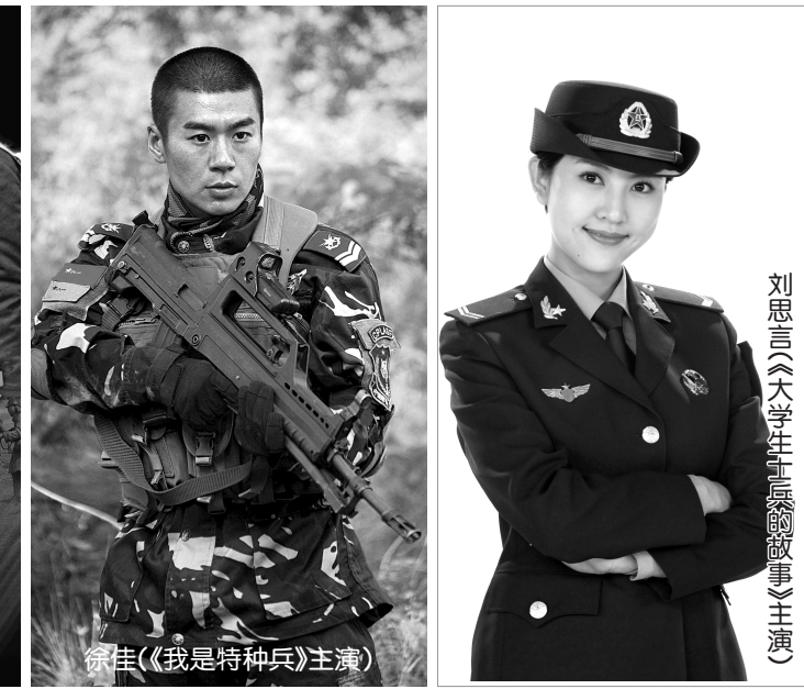
徐佳《我是特种兵》主演