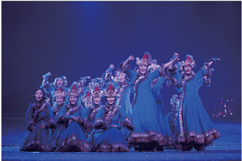
内 蒙 古《呼伦贝尔大雪原》