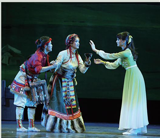
江 苏《格桑花·茉莉花》