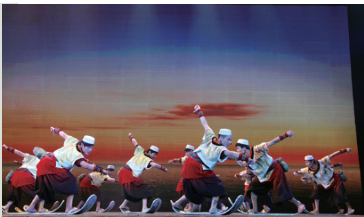
福 建《海歌山魂凤凰情》

恩格斯说过:“文化上的每一进步,都是迈向自由的进步。”文化是国家和民族的根脉所在,文化兴则国兴,文化强则国强。让我们以第四届全国少数民族文艺会演为契机,提高文化自觉,增强文化自信,凝聚全社会的智慧与力量,共同开创少数民族文化百花盛开、争奇斗艳的繁荣局面。