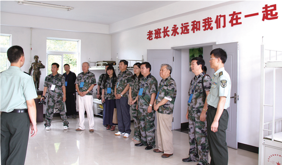
采访团在雷锋班的雷锋班参观采访

海军副政委王兆海在“金锚文学丛书”总序中表示,回望人民海军60多年的奋进历程,海军文学始终紧跟发展先进军事文化的潮流,担当记录历史进程、讴歌伟大时代的使命。大力繁荣海军文学创作,就要始终把培育当代革命军人核心价值观作为根本任务,始终把反映海军重大现实题材作为重要职责,始终把深入一线体验生活作为动力源泉,始终把跟进时代变革、推进海军发展作为孜孜不倦的永恒追求。