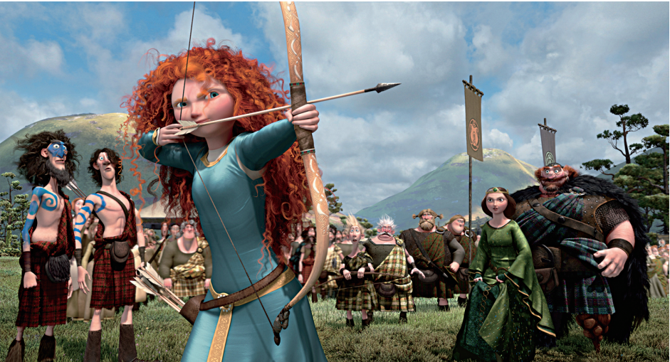
渴望自由的公主梅莉达

若干年前的一个下午,烈日炎炎,蝉声聒噪。三个少女盘腿坐在初三毕业班的教室里。她们忍受着皮肤和掉漆椅子之间的黏汗,向彼此诉说着理想。在难以入睡的夏日里,她们最想要的就是自由。